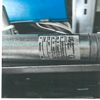
( Kapı Motoru)

Ayrıca E blok 4. Kat kapı kilit tertibatında arızalı olduğu, asansör çalışırken kapının bazan açmadığı tespit edilmiştir. bu asansörün kabin üstünde bulunan yağdanlığında kırılmış olduğu görülmüştür.