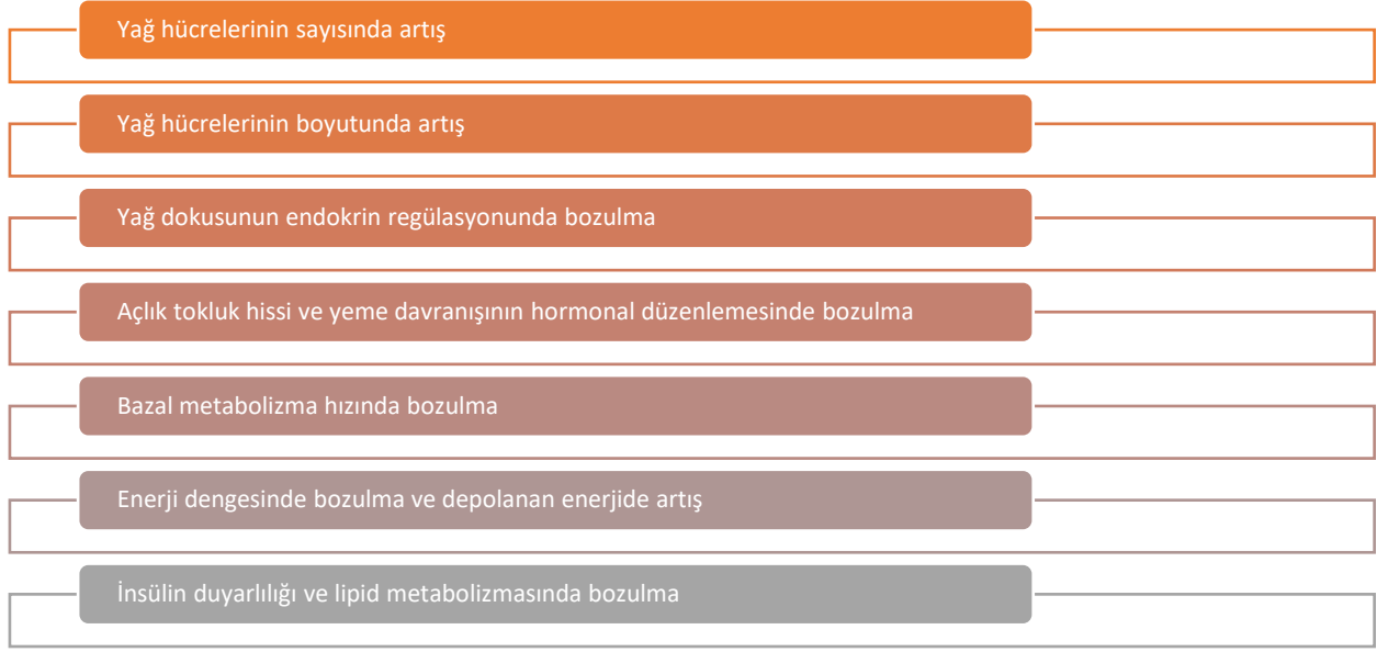
Şekil 6.2. Obezojenik endokrin bozucuların etki mekanizmalarının özeti (Darbre, 2017).

PCB'ler, dioksinler, bromlu alev geciktiriciler ve organoklorlu pestisitler oldukça lipofiliktir ve besin zincirinde ve vücut dokularında birikir. Fitalatlar ve BPA ise lipofilik olmalarına rağmen vücut yağ dokularında daha az birikir ancak yaygın bulunan kimyasallar olmaları nedeni ile maruziyet ve bireyler için etki potansiyelleri yüksektir. Hayatımız boyunca bu EBK'lere maruz kalırız ve birçok farklı kimyasalın diyabet ve obezite ile ilgili risklerde sinerjik etkilerini dikkate almak önemlidir.