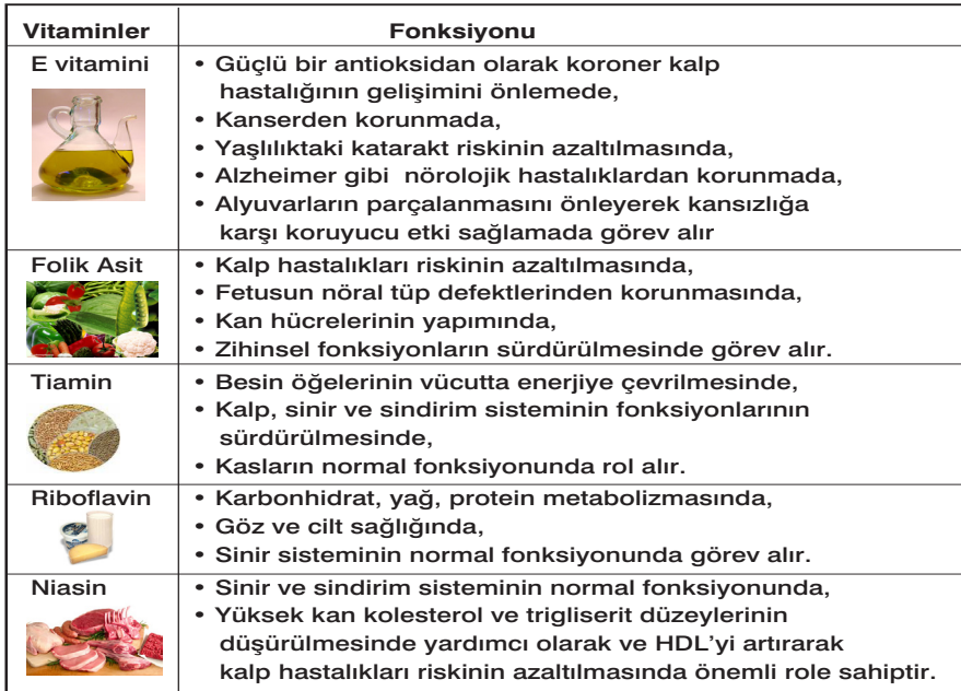
Tablo 4. Bazı Vitaminlerin Vücut Çalışmasındaki İşlevleri

Yağlı tohumlarda bulunan bazı vitaminlerin vücut çalışmasındaki işlevleri Tablo 4'de verilmiştir.