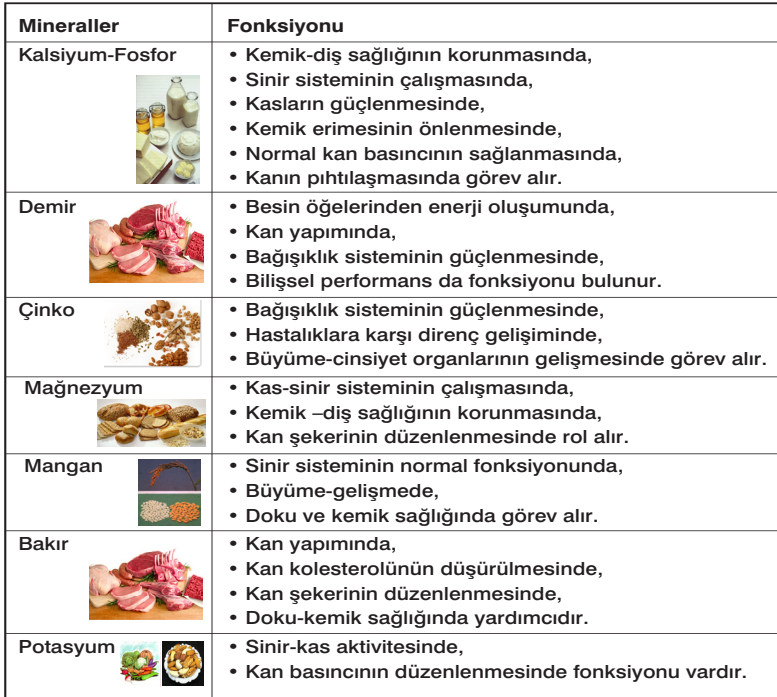
Tablo 6. Bazı Minerallerin Vücut Çalışmasındaki İşlevleri

Yağlı tohumlarda bulunan bazı minerallerin vücut çalışmasındaki işlevleri Tablo 6'da verilmiştir.