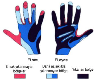
Şekil 3. Yıkama işlemi sırasında genellikle ihmal edilen bölgeler

El yıkamaya uyumun düşük olmasının en önemli nedeni çok zaman almasıdır. El yıkama için sadece 20 saniye gerekli olmasına rağmen lavaboya gidilip ellerin yıkanması, kurulanması ve tekrar hasta başına dönülmesi 40-80 saniye almaktadır. Bu da iş yükünün fazla olduğu ve en fazla el yıkamanın gerekli olduğu yoğun bakım üniteleri başta olmak üzere kliniklerde personelin uyumunu azaltmak-