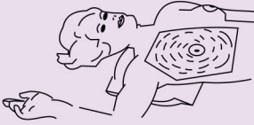
Elle Sirküler Teknik