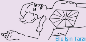
Elle Işın Tarzında